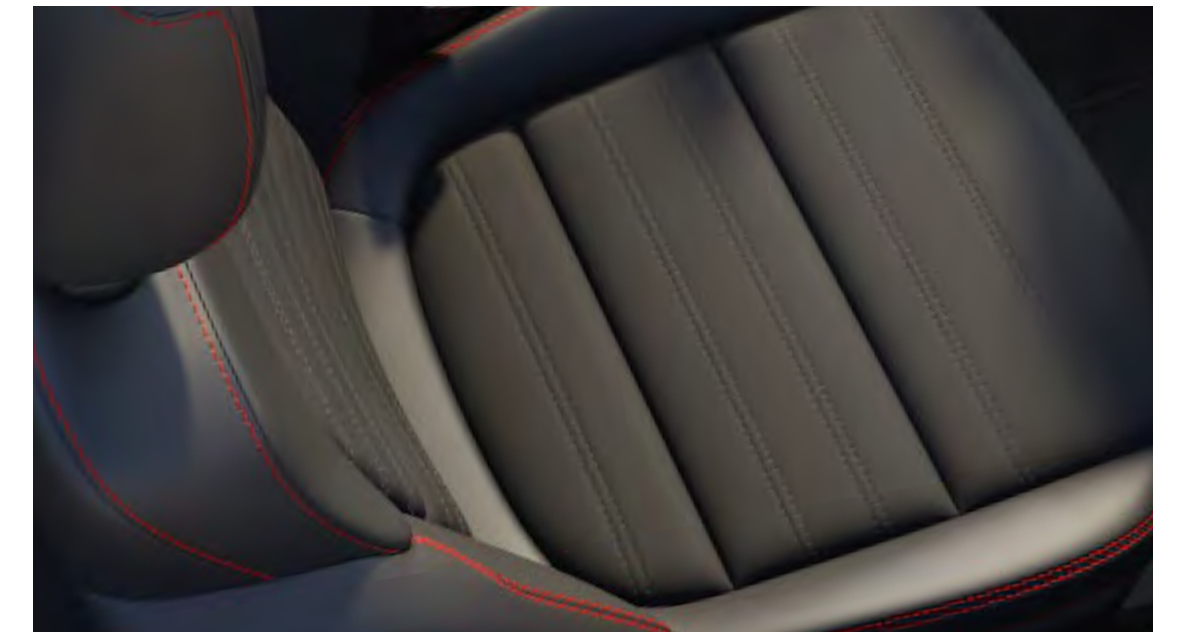
Rapton/Neo Suede med Sensico® man-made läder Standard på ST-Line X & Graphite Tech Edition