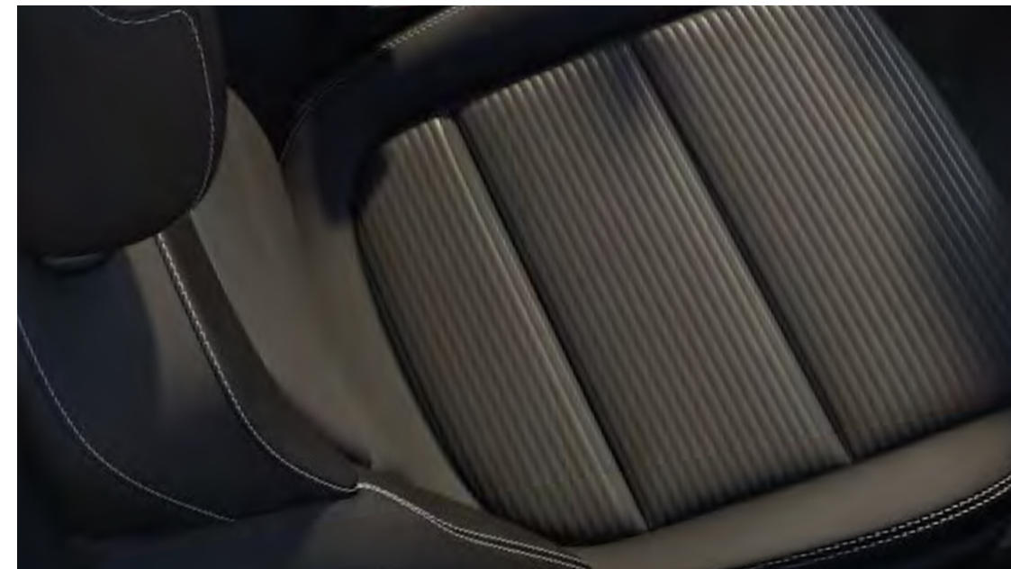
Ray i Ebony/Eton i Ebony Standard på Titanium