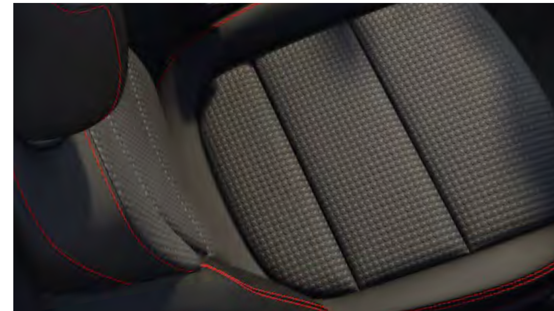
Zaha i Ebony/Eton i Ebony Standard på ST-Line