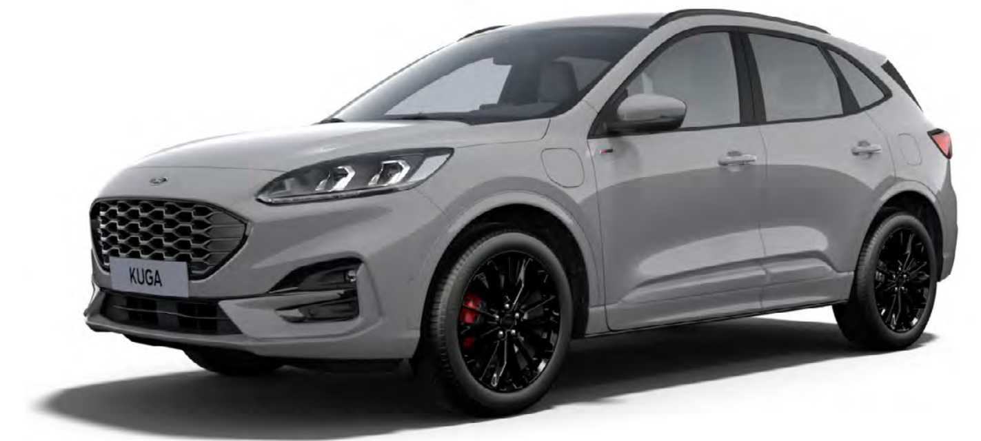
GRAPHITE TECH EDITION