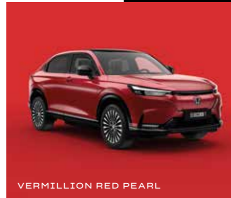
VERMILLION RED PEARL