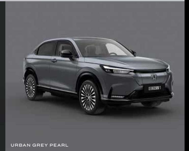
URBAN GREY PEARL