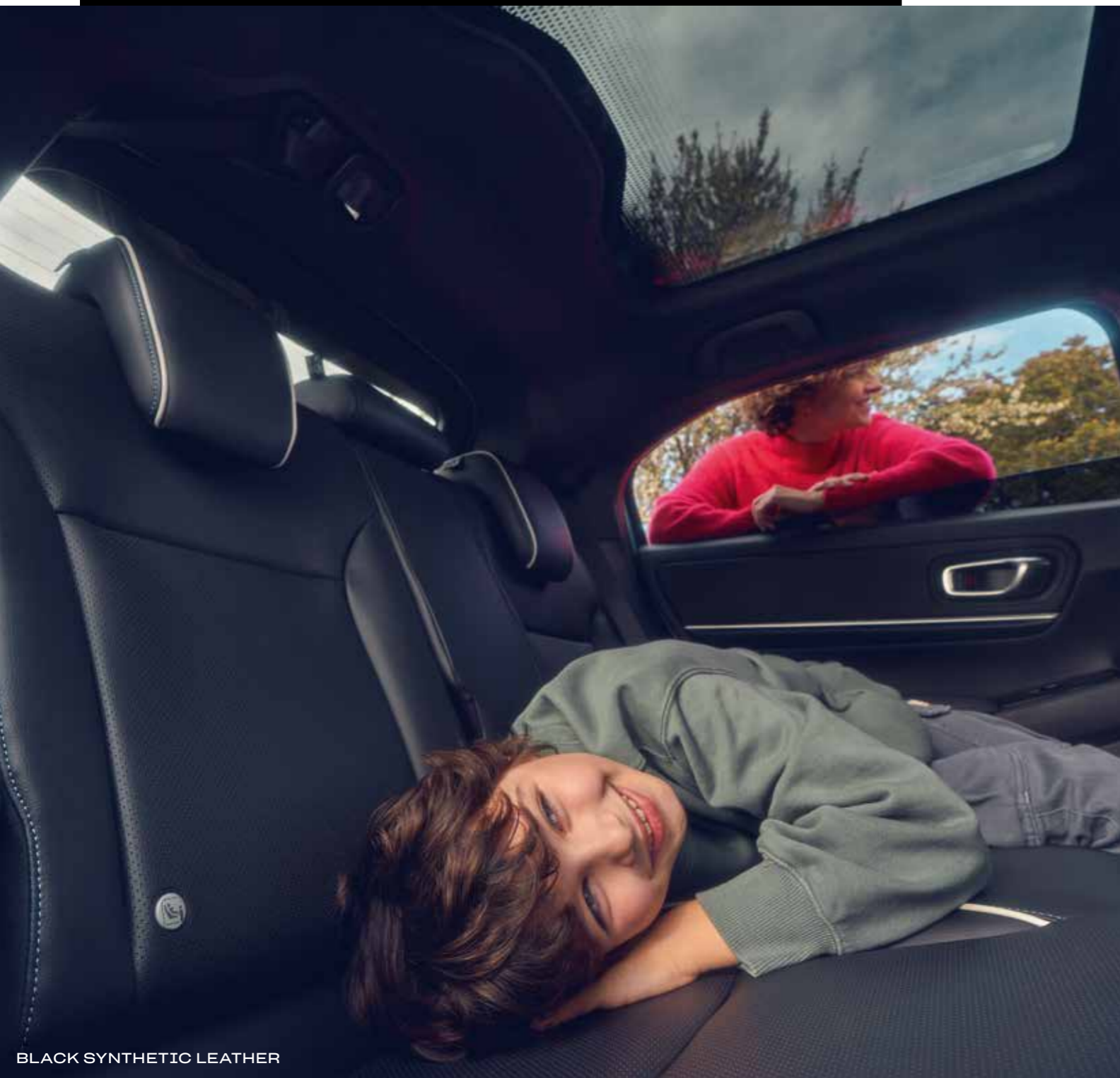
BLACK SYNTHETIC LEATHER

*Select grades and paint colours only. Bilden visar Honda e:Ny1 Full Electric Advance i Aqua Topaz Metallic. Mer information om vilka modeller som dessa och andra funktioner är tillgängliga för finns i tekniska data på sidorna 52–55.