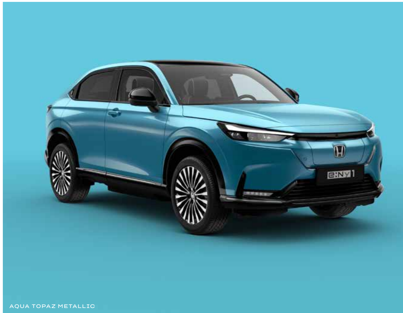
AQUA TOPAZ METALLIC

Välj bland en rad moderna färger som speglar din personlighet och den dynamiska designen på e:Ny1.