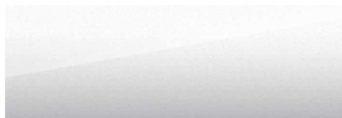
Snow White (vit)