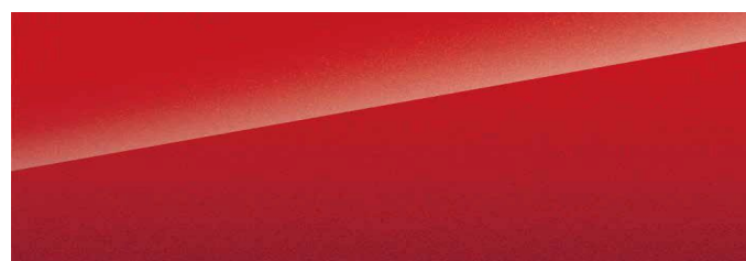
Emperor Red (röd)