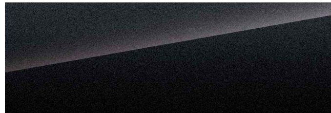
Silver Sand Black (svart)