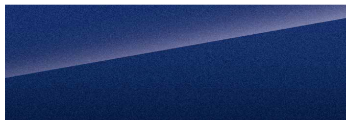
Stony Blue (blå)