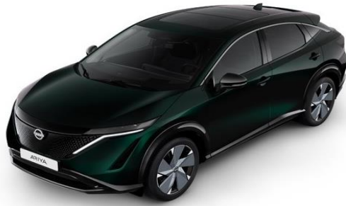
DAP Aurora Green