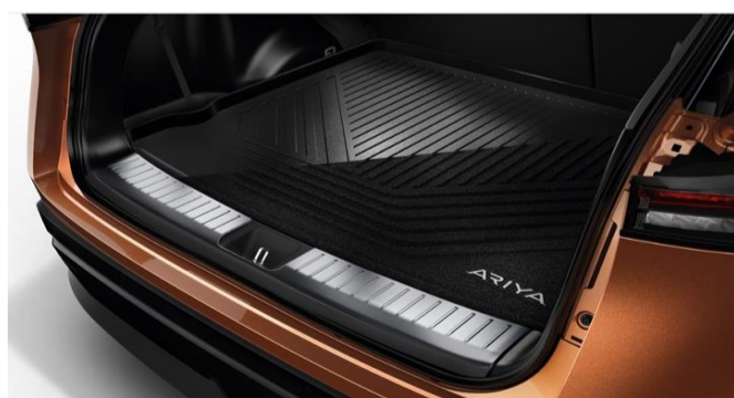
Lastkantsskydd och vändbar bagagerumsmatta