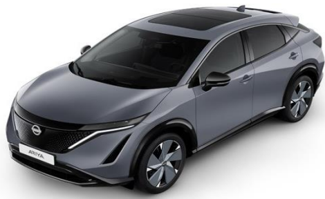
KBY Ceramic Grey