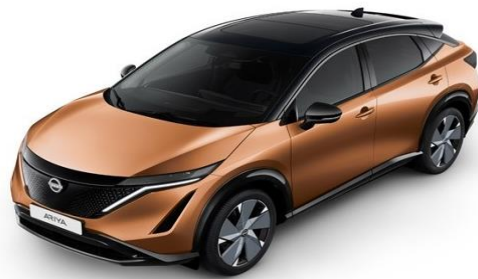
XGJ Akatsuki Copper / Black