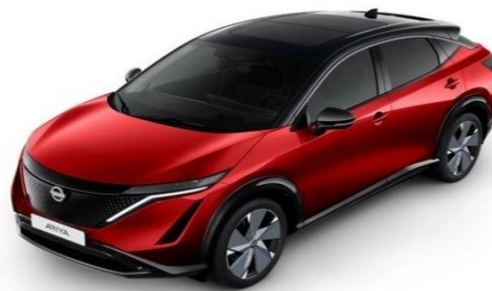
XGD Tinted Red / Black