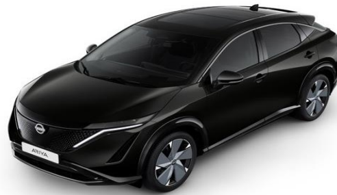
GAT Pearl Black