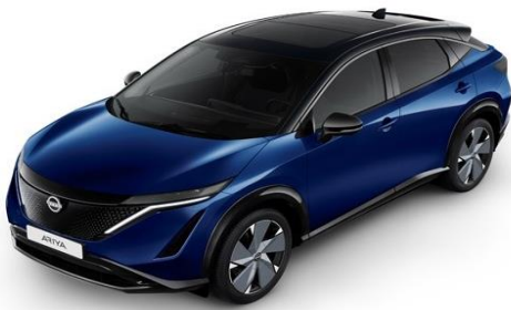
XGU Blue Pearl / Black