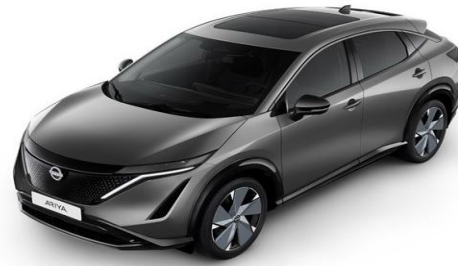
KAD Dark Metal Grey