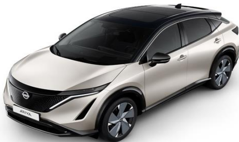
XGV Warm Silver / Black