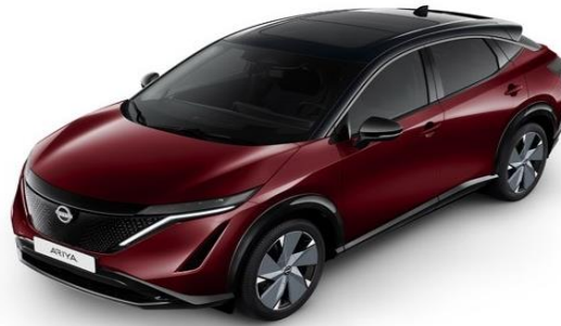
KGG Burgundy / Black