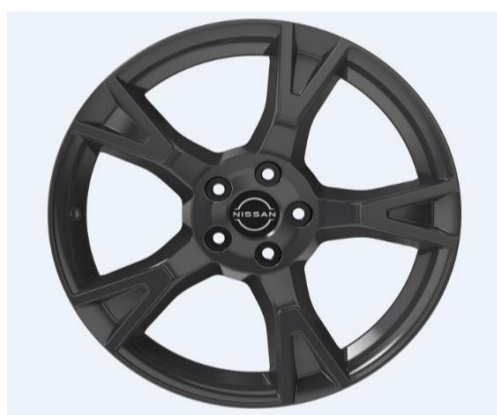
19" lättmetallfälg, vinter - grey

* Information om tillbehör är endast avsedd som en allmän vägledning och utgör på intet sätt någon form av erbjudande eller utfästelse från Nissan. Vi har gjort allt som stått i vår makt för att den information som lämnas här ska vara korrekt. Då vi hela tiden arbetar med att förbättra våra produkter ytterligare, förbehåller vi oss dock rätten att ändra samtliga uppgifter. Lägg speciellt märke till följande: Priserna är endast riktpriiser och innefattar i förekommande fall inte några lackeringskostnader. Priserna anges inklusive moms och montering. Monteringskostnaden kan skilja sig åt mellan olika återförsäljare. Fråga därför din lokala Nissan-återförsäljare om det exakta priset. Tillbehör och annan extrautrustning som monteras kan påverka bilens förbrukning och räckvidd.