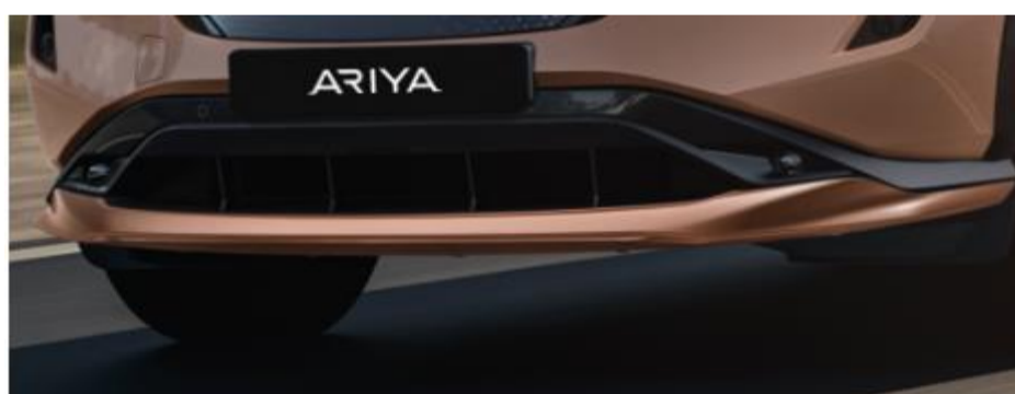
Stylingplatta fram - copper