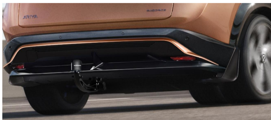
Stylingplatta bak - copper , stänkskydd bak och avtagbar dragkoppling