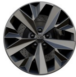
18" aluminiumfälg (Hybrid GT Line)