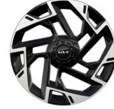
19" aluminiumfälg (Plug-in Hybrid GT Line)