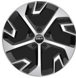
18" aluminiumfälg (Hybrid Action & Advance)