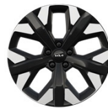
19" aluminiumfälg (Plug-in Hybrid Action & Advance)