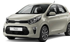
Milky Beige (M9Y) pearleffekt