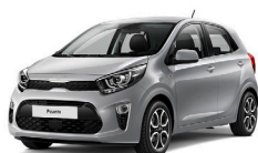
Sparkling Silver (KCS) metallic