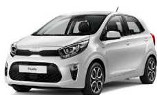
Clear White (UD) solid