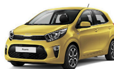
Honey Bee (B2Y) metallic

Kia Sweden AB Kanalvägen 10A 194 61 Upplands Väsby Sverige Tfn: 08 - 400 443 00 www.kia.com