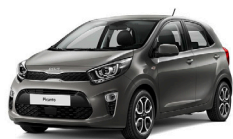
Astro Grey (M7G) metallic