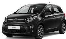
Aurora Black Pearl (ABP) pearleffekt