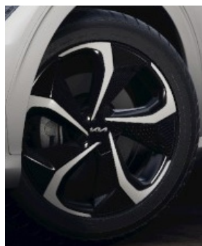
20" Tillval till GT LINE Continental Preliminär räckvidd 456km