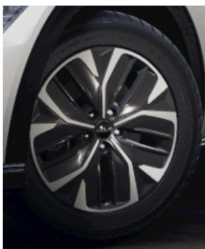
19" EV6 & EV6 PLUS Kumho eller Nexen