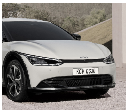
EV6 & EV6 PLUS