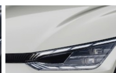
Glacier (GLB) metallic

Kia Motors Sweden AB Kanalvägen 10A 194 61 Upplands Väsby Sverige Tfn: 08 - 400 443 00 www.kia.com