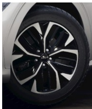
19" GT LINE Kumho eller Nexen