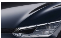
Aurora Black Pearl (ABP) metallic (pearleffekt)