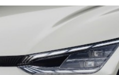
Snow White Pearl (SWP) metallic (pearleffekt)