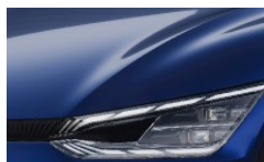
Yacht Blue (DU3) metallic