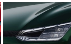
Deep Forest (G4E) metallic