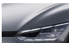
Steel Grey (KLG) metallic