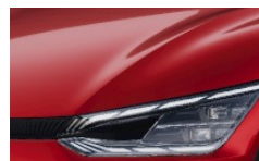
Runway Red (CR5) metallic