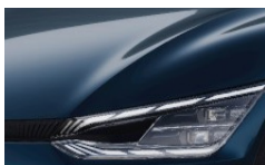
Gravity Blue (B4U) metallic