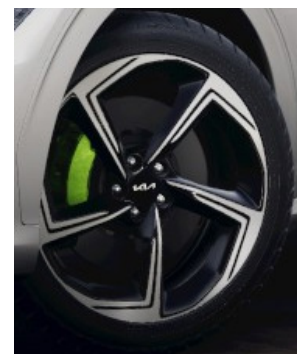
21" GT Michelin