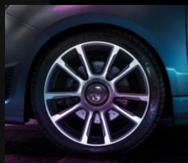
17" lättmetallfälgar, Turismo