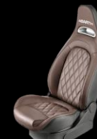
BRUNA SPORTSTOLAR, "HELMET BROWN" LÄDERKLÄDSEL