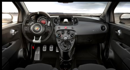
SVART MED MATTLACKAD INSTRUMENTBRÄDA