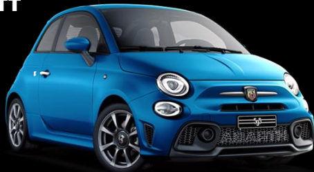
BLÅ, 131 ABARTH (948)

Villkor: Vänligen observera: vissa tillval, utrustningspaket och tillbehör kanske inte längre finns till försäljning på grund av rådande produktionsbegränsningar. För mer detaljerad information vänligen kontakta din auktoriserade Abarth-återförsäljare. Alla nybilspriser i denna prisöversikt är rekommenderade priser inkl. leveranskostnader och moms. Denna prislista gäller från 15 Maj 2022. CO2-utsläpp 152 – 161 g/km. Den angivna värderna är preliminära och baserad på WLTP och blandad körning. Miljöklass Euro6d_Final. Bilderna på bilderna är illustrativa och kan vara extrautrustade. Abarth Sverige förbehåller sig rätten att ändra priserna samt reserverar sig för eventuella tryckfel. Information om priser och utrustning samt specifikationer är av vägledande slag och kan ändras utan föregående meddelande. Alla rimliga ansträngningar har gjorts för att innehållet i denna prislista skall vara uppdaterat och korrekt vid trycktilfället. Importör: Italmotor Sweden AB