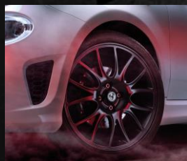
17" lättmetallfälgar, Formula