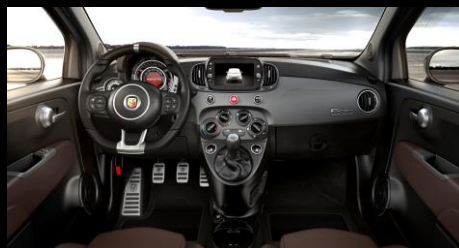
BRUN MED MATTLACKAD INSTRUMENTBRÄDA