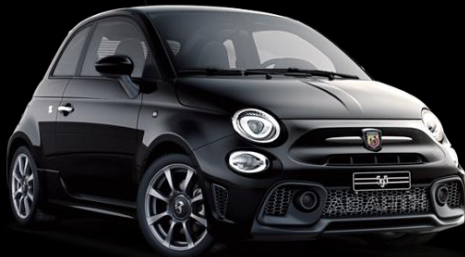
SVART, SCORPIONE (876)