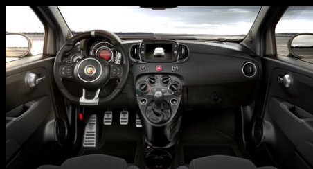
SVART MED MATTLACKAD INSTRUMENTBRÄDA