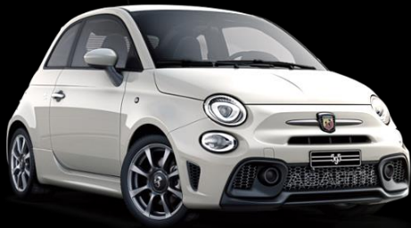
VIT, GARA (268)

FINNS ÄVEN SOM BI-COLOR MED SVART TAK (103)