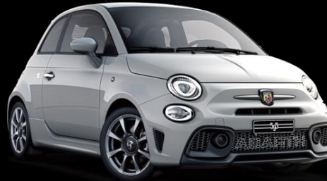
GRÅ, CAMPOVOLO (676)

FINNS ÄVEN SOM BI-COLOR MED SVART TAK (103)