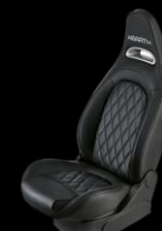
SVARTA SPORTSTOLAR, LÄDERKLÄDSEL