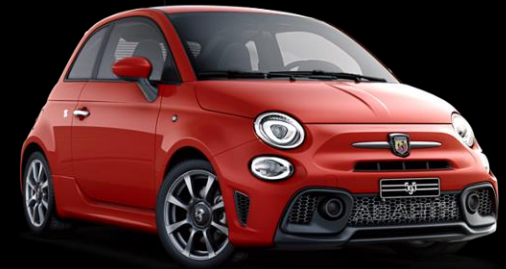
RÖD, ABARTH (176)

FINNS ÄVEN SOM BI-COLOR MED SVART TAK (890)