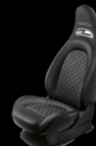
SVARTA SPORTSTOLAR, TYGKLÄDSEL