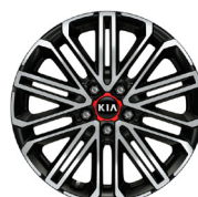
18 " aluminiumfälg med röd centrumkåpa (GT)