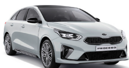
Cassa White (WD) solid (ej GT)