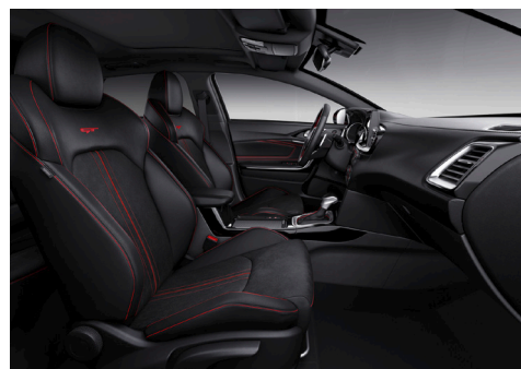
Svart interiör med Sportstolar, svart delläderklädsel med mockaimitation och röda kontrastsömmar (GT)