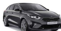
Dark Penta Metal (H8G) metallic