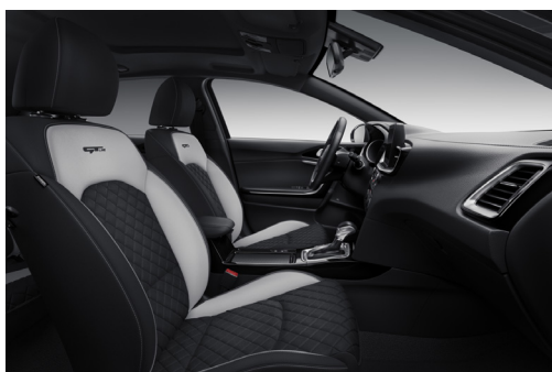
Svart interiör med artificiell delläderklädsel, quiltad i svart/ljusgrå med kontrastsömmar (GT Line)