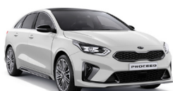
Deluxe White (HW2) metallic (pearleffekt)