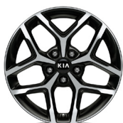
17 " aluminiumfälg (GT Line)