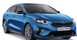
Blue Flame (B3L) metallic (pearleffekt)