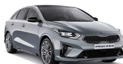
Lunar Silver (CSS) metallic