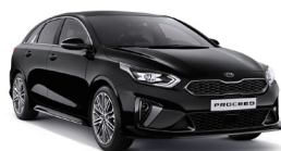
Black Pearl (1K) metallic (pearleffekt)