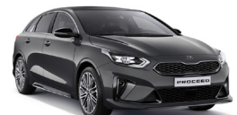
Dark Penta Metal (H8G) metallic