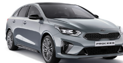
Lunar Silver (CSS) Metallic