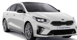
Deluxe White (HW2) metallic (pearleffekt)