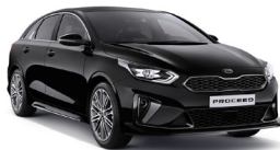
Black Pearl (1K) metallic (pearleffekt)