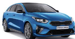
Blue Flame (B3L) Metallic (pearleffekt)