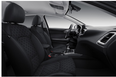
Svart interiör med svart tygklädsel. Invändiga detaljer i matt kromfinish (Action)