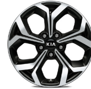
17 " aluminiumfälg (Advance Plus)