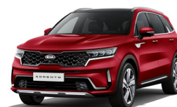
Runway Red (CR5) metallic

Kia Motors Sweden AB Kanalvägen 10A 194 61 Upplands Väsby Sverige Tfn: 08 - 400 443 00 www.kia.com