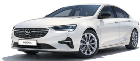
GAZ - Summit White