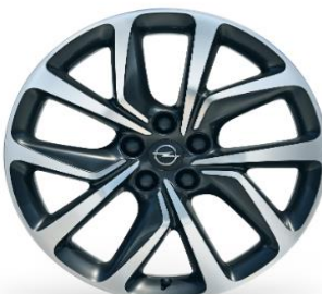
20" Lättmetallfälgar Grey Gloss Diamond Cut 8.5J x 20 Kod: PYU