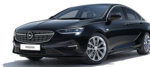
GB9 - Mineral Black