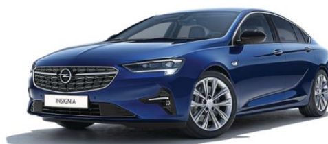
G4B - Nautic Blue