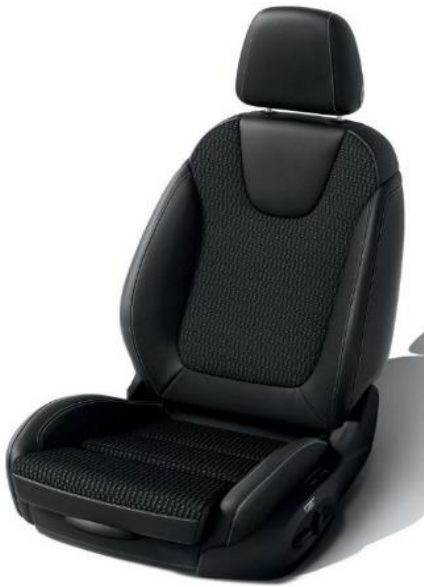
TASM - Tyg/Vinylklädsel, "Monita" Jet black