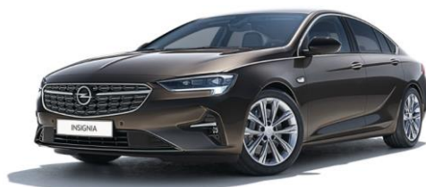
G1S - Stone Brown