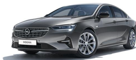
GF6 - Satin steel Grey