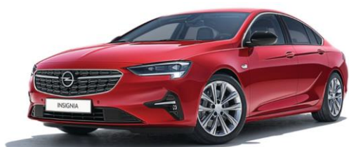
G1R - Pepperoncino