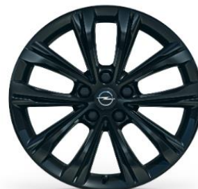
18" Lättmetallfälgar Multi-Spokes Design, black gloss Kod: RRM