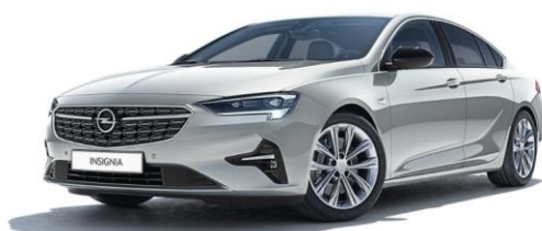
GAN - Switchblade Silver