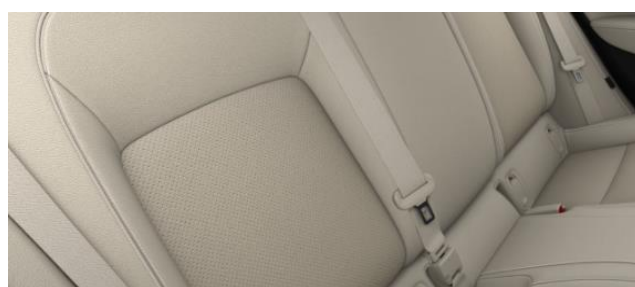
TASQ - Läderklädsel Siena II - Beige