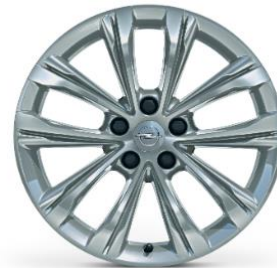
18" Lättmetallfälgar Multi-Spokes Design, Silver Kod: RQ8