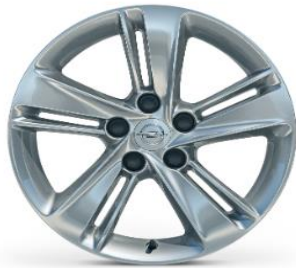
17" Lättmetallfälgar Silver 7.5J x 17 Kod: RSC