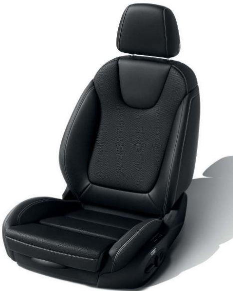
TATW - Läderklädsel Siena II - Jet Black