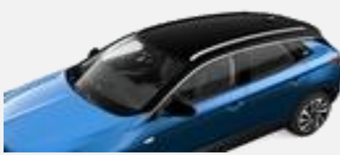
Svart tak 22T Standard