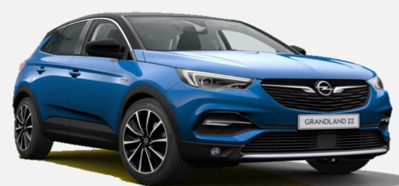
Topaz Blue G8Z 7 900kr