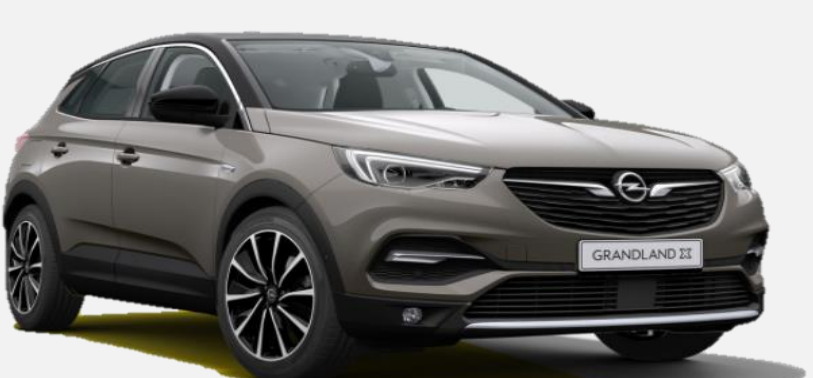
Moonstone Grey G4o 6 900kr