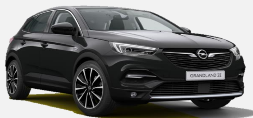
Diamond Black G7o 6 900kr