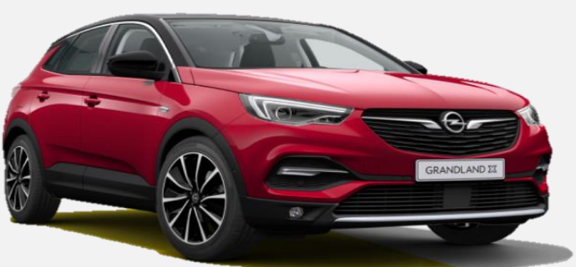
Dark Ruby Red GDU 7 900kr