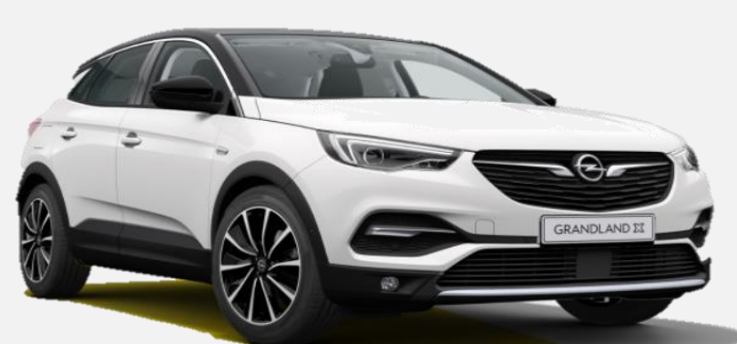
White Jade G2o 0 kr