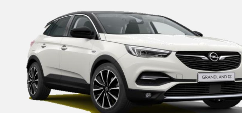
Pearl White G1o 7 900kr