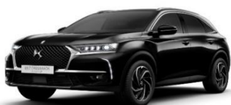
Svart Perla Nera