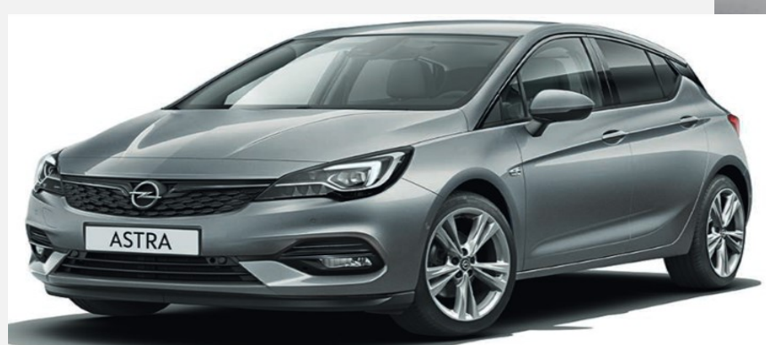
Cosmic Grey GR5 5 900kr