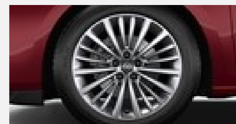
TILLVAL ULTIMATE - 3900kr 17" Lättmetallfälgar