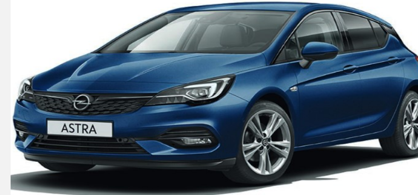
Nautic Blue G4B 5 900kr