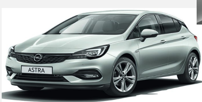
Switchblade Silver GAN 5 900kr