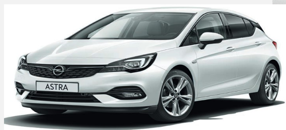
Summit White GAZ 2 900kr