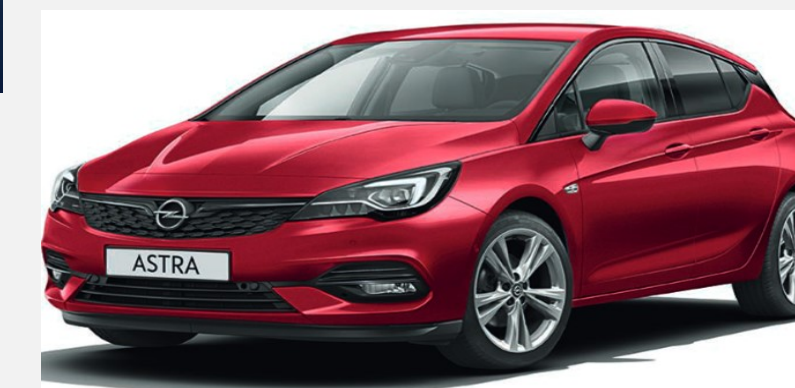
Hot Red G1R 0 kr