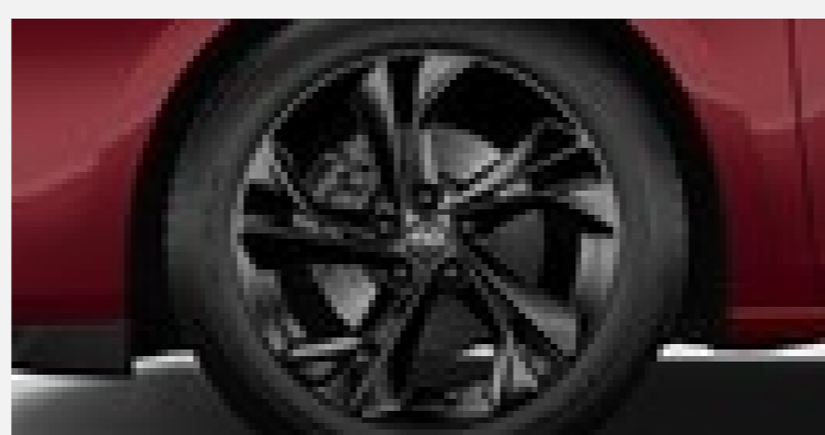
ULTIMATE 17" Lättmetallfälgar