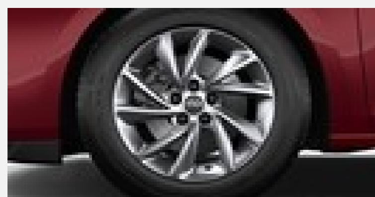
Business Elegance/Classic Edition 16" Lättmetallfälgar