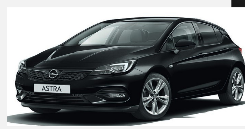
Mineral Black GB9 5 900kr