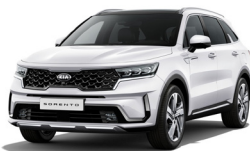
Snow White Pearl (SWP) metallic pearleffekt