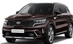
Essence Brown (BE2) metallic