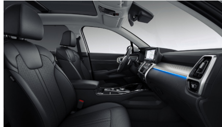
Svart läderklädsel (Advance)