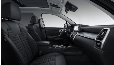
Mörk Tygklädsel (Action)