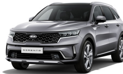
Steel Grey (KLG) metallic