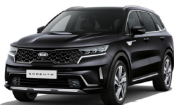
Aurora Black Pearl (ABP) metallic pearleffekt