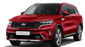
Runway Red (CR5) metallic

Kia Motors Sweden AB Kanalvägen 10A 194 61 Upplands Väsby Sverige Tfn: 08 - 400 443 00 www.kia.com