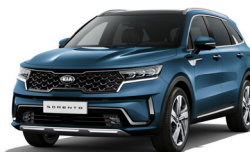
Mineral Blue (M4B) metallic