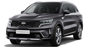
Platinum Graphite (ABT) metallic