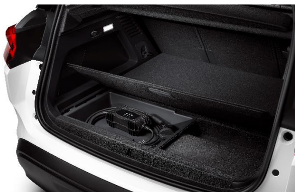
Laddkabeln förvaras praktiskt under golvet i bagageluckan