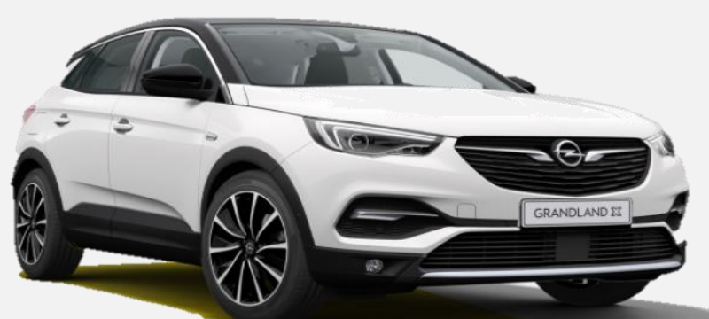
White Jade G2o 0 kr