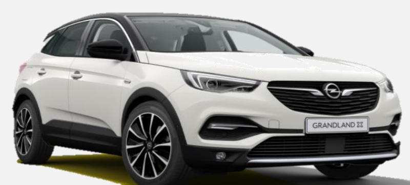
Pearl White G1o 7 900kr