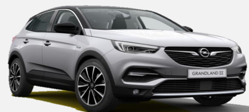
Quartz Grey G4i 6 900kr