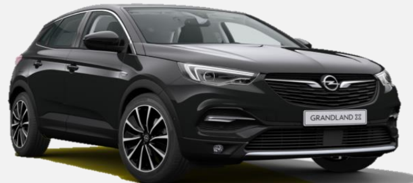
Diamond Black G7o 6 900kr