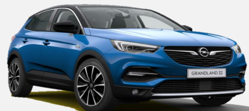
Topaz Blue G8Z 7 900kr