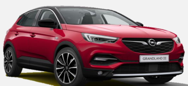
Dark Ruby Red GDU 7 900kr