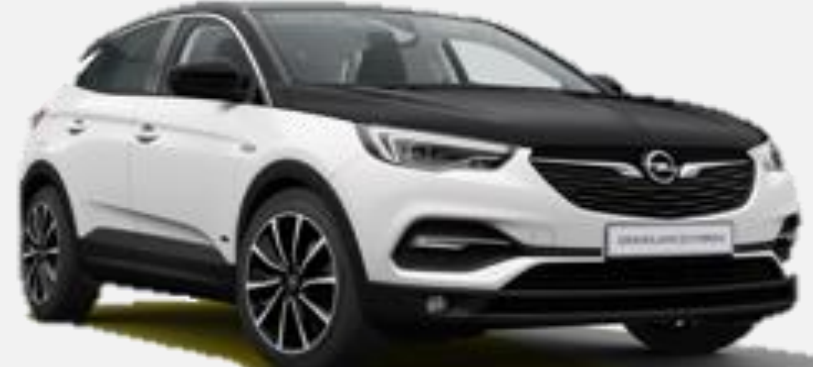
Svart Motorhuv CNP 2 500kr Tillval Ultimate