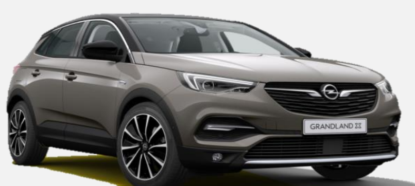
Moonstone Grey G4o 6 900kr