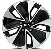
16" aluminiumfälg (Advance & Advance Plus)