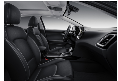
Svart interiör med läderklädsel. Invändiga detaljer i matt aluminium- och blanksvart finish (Advance Plus 2)