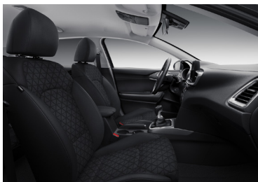
Svart interiör med svart tygklädsel. Invändiga detaljer i matt kromfinish (Advance)