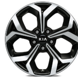
17" aluminiumfälg (Advance Plus 2)