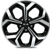
17 " aluminiumfälg (Advance)