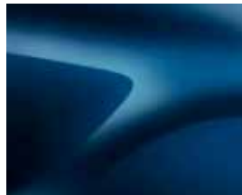
BLÅ COSMOS (RPR) (2)