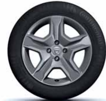
NAVKAPSEL 16" BAYADÈRE MÖRKGRÅ METALLIC**