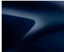
MARINBLÅ (D42) *(1)