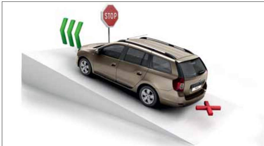
Starthjälp i backe : Systemet ger dig extra tid att komma iväg, utan att du behöver oroa dig för att rulla baklänges.

Här finns också krockkuddar fram och på sidan, Isofix-fästen för barnstol på de båda sidoplatserna bak, starthjälp i backe och parkeringsradar bak. Det ska kännas tryggt att ge sig ut på vägen!