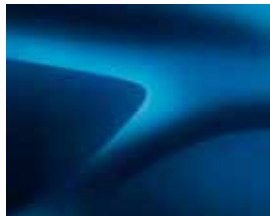
BLÅ AZURIT (RPL) ***(2)