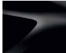
NATTSVART (676) (2)