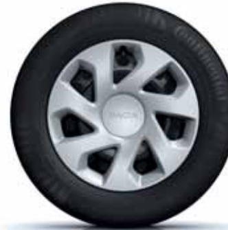
NAVKAPSEL 15" GROOM*