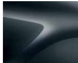
KOMETGRÅ (KNA) (2)