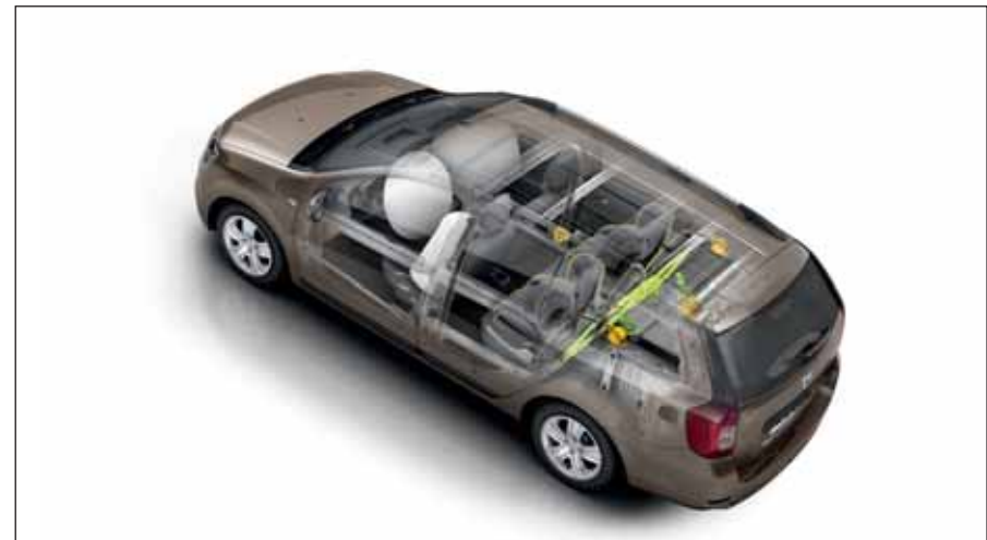
Skydd : Förstärkt kaross, krockkuddar fram och på sidan framtill och Isofix-fästen på sidoplatserna i baksätet.