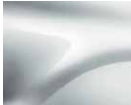
SNÖVIT (369) (1)