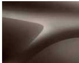
BRUN VISON (CNM) (2)