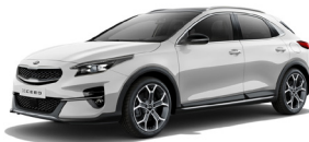
Deluxe White (HW2) metallic (pearleffekt)