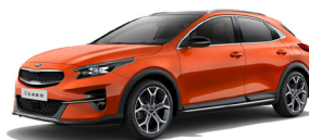
Orange Fusion (RNG) Speciallack