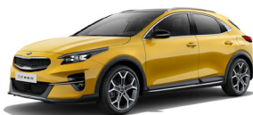
Quantum Yellow (YQM) Speciallack