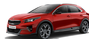
Infra Red (AA9) metallic

Kia Motors Sweden AB Kanalvägen 10A 194 61 Upplands Väsby Sverige Tfn: 08 - 400 443 00 www.kia.com