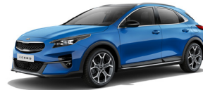
Blue Flame (B3L) Metallic (pearleffekt)