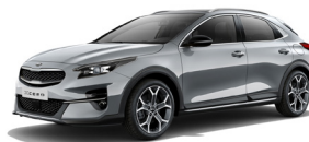
Lunar Silver (CSS) Metallic