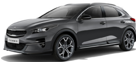
Dark Penta Metal (H8G) metallic