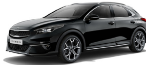
Black Pearl (1K) metallic (pearleffekt)