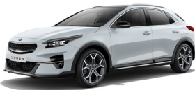
Cassa White (WD) solid