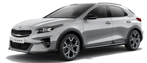
Sparkling Silver (KCS) Metallic