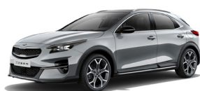
Lunar Silver (CSS) Metallic