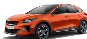
Orange Fusion (RNG) Speciallack