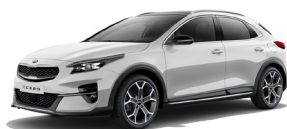
Deluxe White (HW2) metallic (pearleffekt)