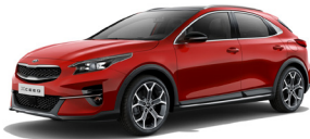
Infra Red (AA9) metallic

Kia Motors Sweden AB Kanalvägen 10A 194 61 Upplands Väsby Sverige Tfn: 08 - 400 443 00 www.kia.com