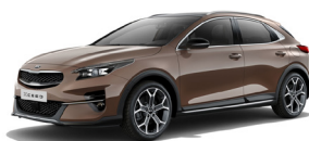
Copper Stone (L2B) metallic (pearleffekt)