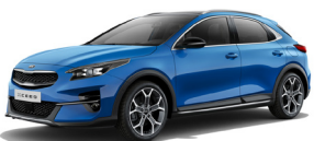
Blue Flame (B3L) Metallic (pearleffekt)