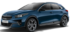
Cosmo Blue (CB7) Metallic