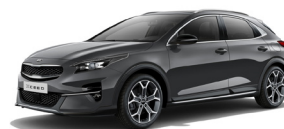
Dark Penta Metal (H8G) metallic