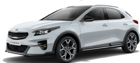
Cassa White (WD) solid