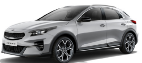
Sparkling Silver (KCS) Metallic