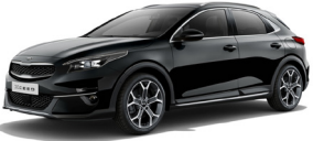
Black Pearl (1K) metallic (pearleffekt)