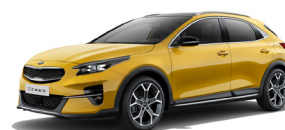
Quantum Yellow (YQM) Speciallack