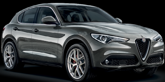
318 - Grå Stromboli