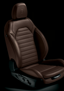
Veloce - Brunt läder (tillval)