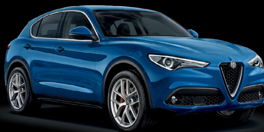
756 - Blå Misano