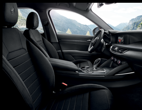
Stelvio - Svart tyg

S = Standard O = Tillval - = Ej beställningsbar