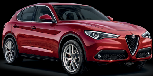
361 - Röd Competizione