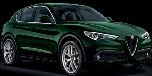
800 - Grön Racing