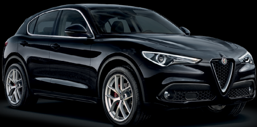
408 - Svart Vulcano