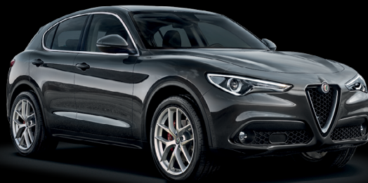
035 - Grå Vesuvio