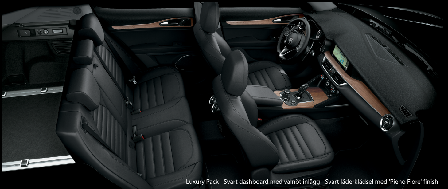
Luxury Pack - Svart dashboard med valnöt inlägg - Svart läderklädsel med 'Pieno Fiore' finish