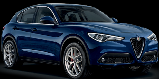
092 - Blå Montecarlo