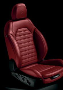
Veloce - Rött läder (tillval)