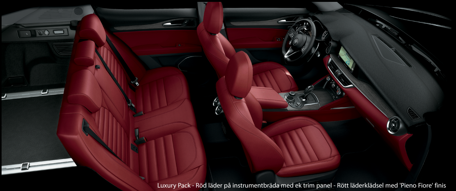
Luxury Pack - Röd läder på instrumentbräda med ek trim panel - Rött läderklädsel med 'Pieno Fiore' finis