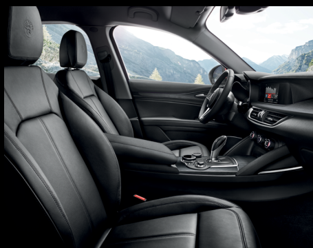
Stelvio / Super - Svart läder (tillval)