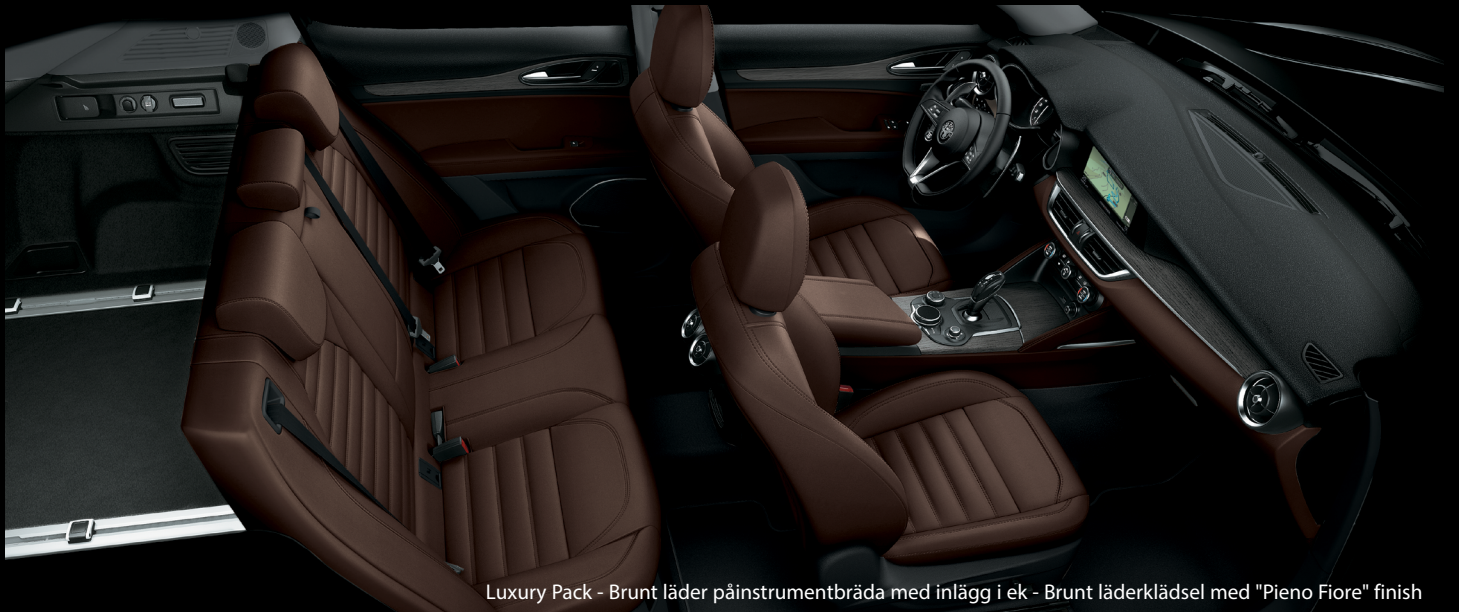
Luxury Pack - Brunt läder på instrumentbräda med inlägg i ek - Brunt läderklädsel med "Pieno Fiore" finish