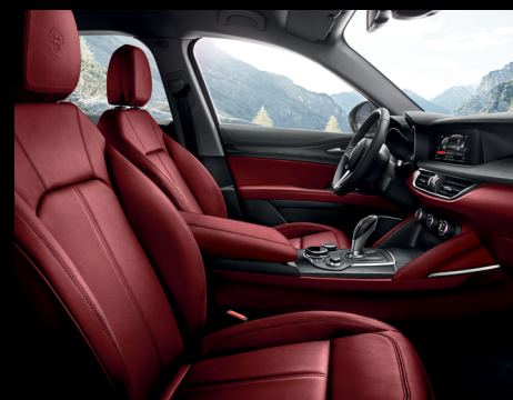
Super - rött läder (tillval)