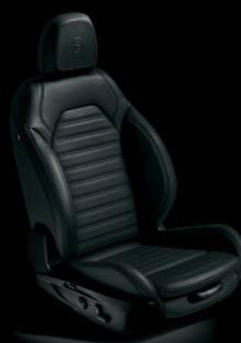
Veloce - Svart läder (tillval)