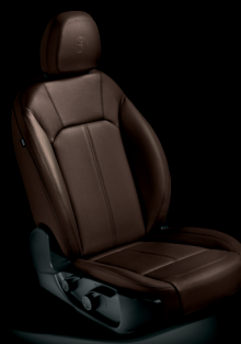
Super - Brunt läder (tillval)