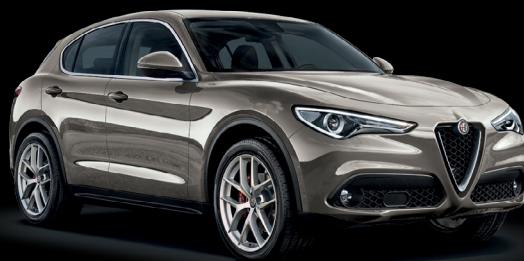
082 - Titanio Imola