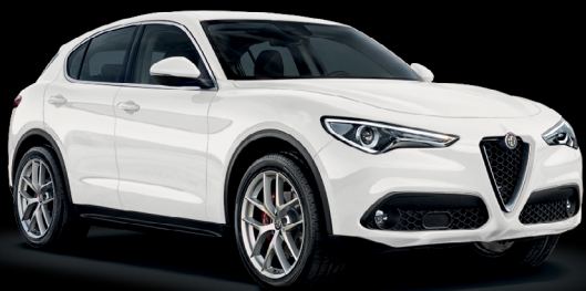
217 - Vit Alfa