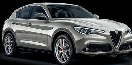
620 - Grå Silverstone