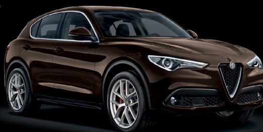
480 - Brun Balsalto