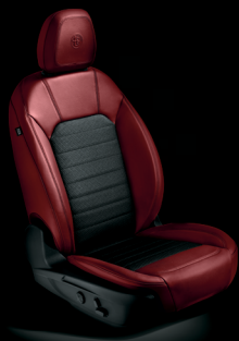
Super - Tyg / Rött läder