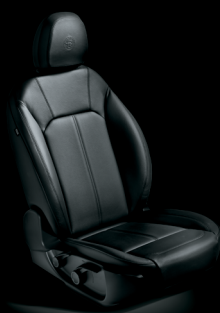
Super - Svart läder (tillval)