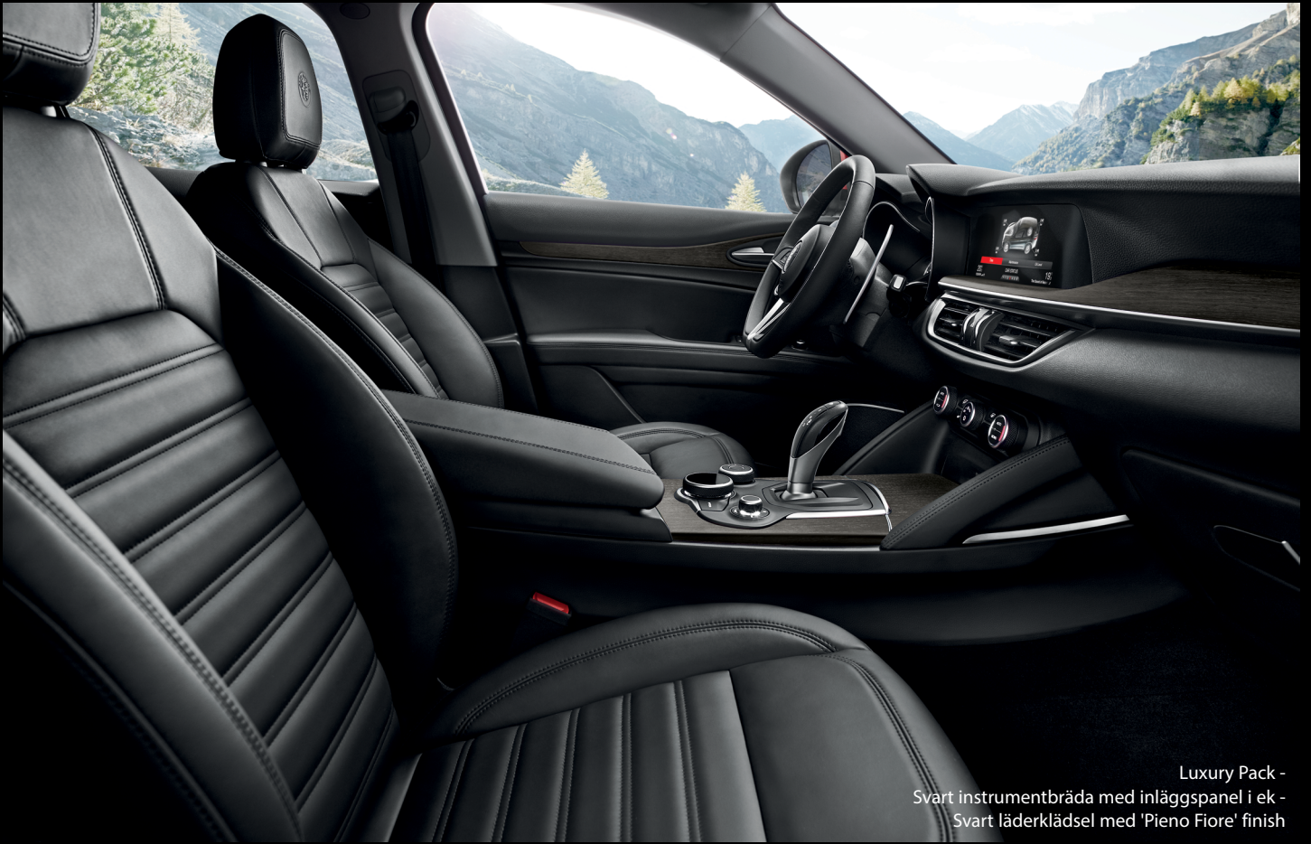
Luxury Pack - Svart instrumentbräda med inläggspanel i ek - Svart läderklädsel med 'Pieno Fiore' finish