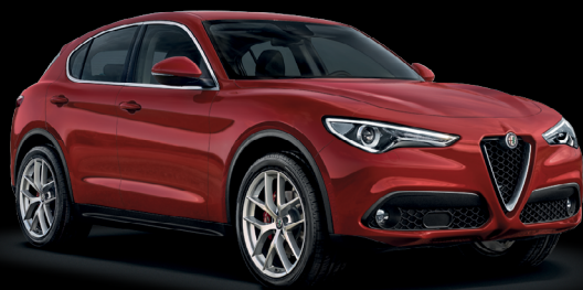
414 - Röd Alfa