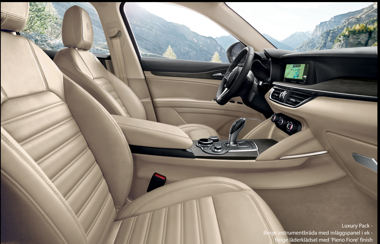
Luxury Pack - Beige instrumentbräda med inläggspanel i ek - Beige läderklädsel med 'Pieno Fiore' finish