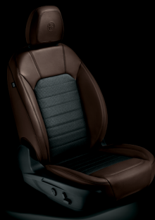
Super - Tyg / Brunt läder