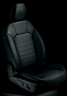
Super - Tyg / Svart läder