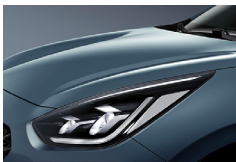
Horizon Blue (BBL) metallic