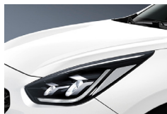
Snow White Pearl (SWP) metallic (pearleffekt)