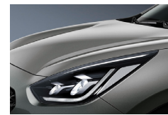
Steel Grey (KLG) metallic