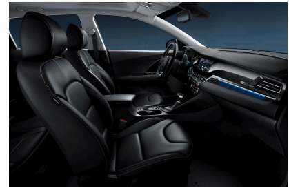
Saturn Black (std. PlusPaket 2) Svart konstläder, paneler i svart.