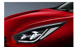
Runway Red (CR5) metallic

Kia Motors Sweden AB Kanalvägen 10A 194 61 Upplands Väsby Sverige Tfn: 08 - 400 443 00 www.kia.com