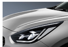
Silky Silver (4SS) metallic