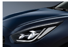
Gravity Blue (B4U) metallic