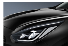
Aurora Black Pearl (ABP) metallic (pearleffekt)