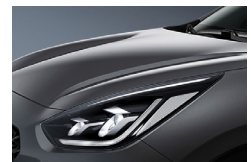
Platinum Graphite (ABT) metallic