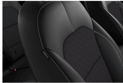
Saturn Black (std. PlusPaket 1) Svart konstläder/tyg, paneler i svart.