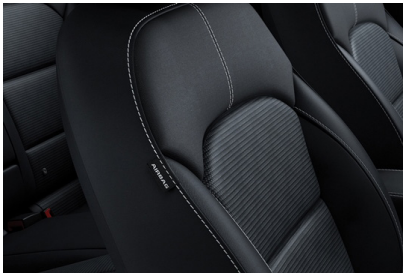
Saturn Black (std. Advance) Svart tyg, paneler i svart.