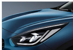
Deep Cerulean Blue (C3U) metallic