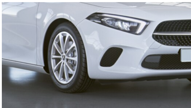
Lättmetalfälgar 43,2 cm (17") i 10- ekerdessign lackerade i vanadiumsilver