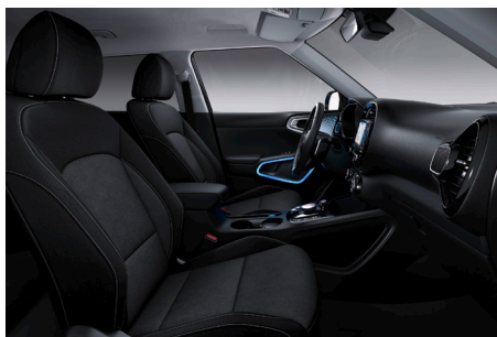
Svart interiör med artificiell delläderklädsel och grå kontrastsömmar (Advance)