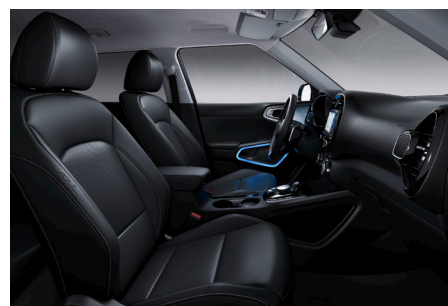
Svart interiör med helläderklädsel, och grå kontrastsömmar (Advance Plus)