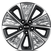
17" aluminiumfälg med aerodynamisk utformning