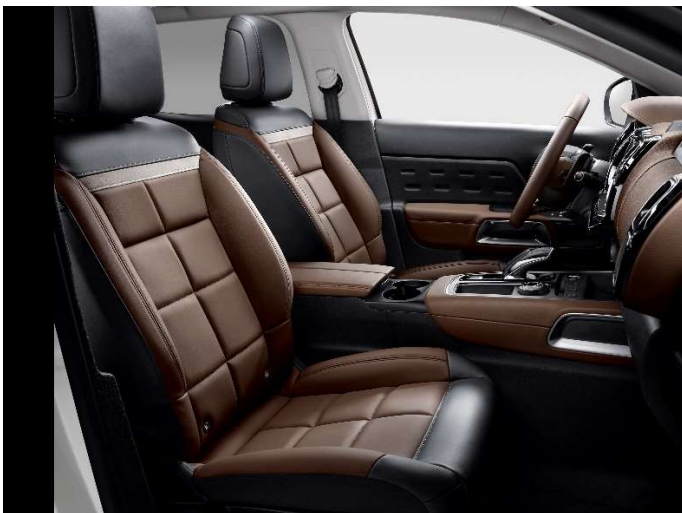
Interiör; Hype Brown, Nappalädersklädsel