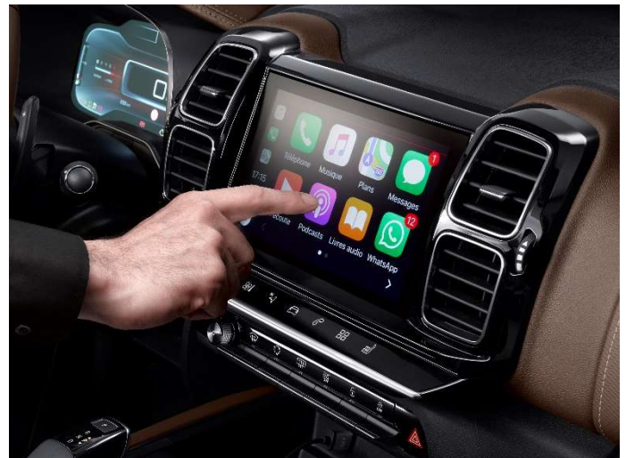
Mirror Screen: Apple CarPlay™ & MirrorLink®

Utrustning och specifikationer gäller för bilar producerade från publiceringsdatum för produktfaktbladet.