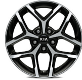
17 " aluminiumfälg (GT Line)