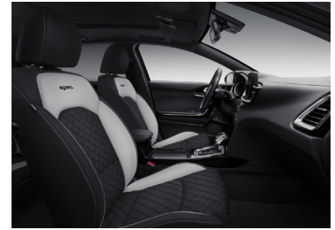
Svart interiör med artificiell delläderklädsel, quiltad i svart/ljusgrå med kontrastsömmar (GT Line)