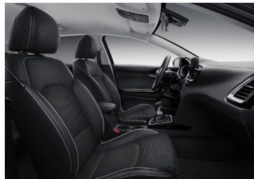
Svart interiör med svart artificiell delläderklädsel. Invändiga detaljer i matt aluminium- och blanksvart finish (Advance Plus)