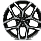
17 " aluminiumfälg (GT Line)