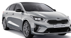
Sparkling Silver (KCS) Metallic