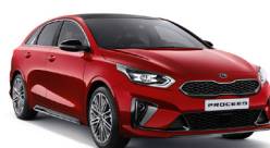
Infra red (FRD) metallic (Ej GT)