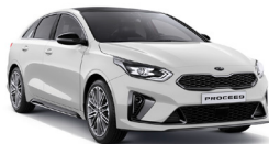
Deluxe White (HW2) metallic (pearleffekt)