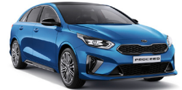
Blue Flame (B3L) Metallic (pearleffekt)