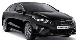
Black Pearl (1K) metallic (pearleffekt)