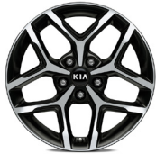
17 " aluminiumfälg (GT Line)