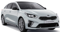
Cassa White (WD) solid (Ej GT)