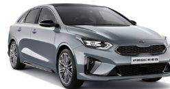
Lunar Silver (CSS) Metallic