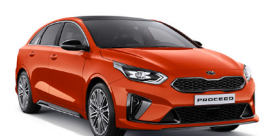
Orange Fusion (RNG) metallic (Specialfärg)

Kia Motors Sweden AB Kanalvägen 10A 194 61 Upplands Väsby Sverige Tfn: 08 - 400 443 00 www.kia.com