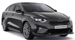
Dark Penta Metal (H8G) metallic