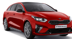
Track Red (FRD) Solid