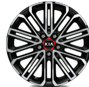
18 " aluminiumfälg med röd centrumkåpa (GT)