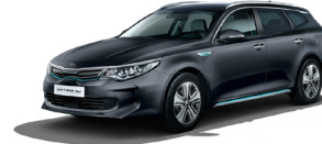
Platinum Graphite (ABT) metallic