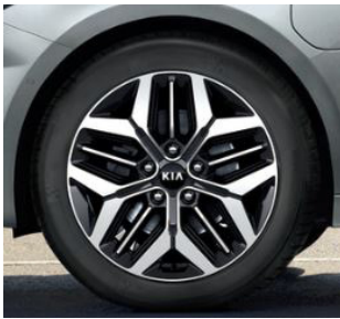
17 " aluminiumfälg