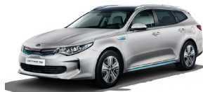
Silky Silver (4SS) metallic