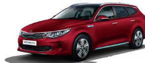
Runway Red (CR5) metallic