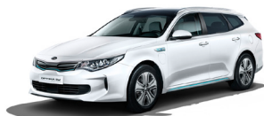
Clear White (UD) solid

*Bilderna nedan visar föregående modell och kommer att uppdateras vid senare tillfälle.