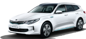
Snow White Pearl (SWP) metallic (pearleffekt)