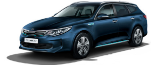
Gravity Blue [B4U] metallic