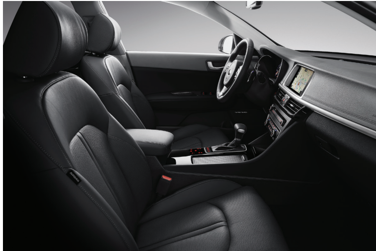
Svart interiör med svart läderklädsel (std.)