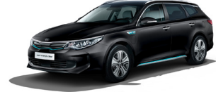
Aurora Black Pearl (ABP) metallic (pearleffekt)

Kia Motors Sweden AB Kanalvägen 10A 194 61 Upplands Väsby Sverige Tfn: 08 - 400 443 00 www.kia.com