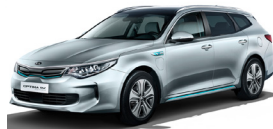
Aluminium Silver (C3S) metallic