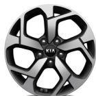
17 " aluminiumfälg (Advance)