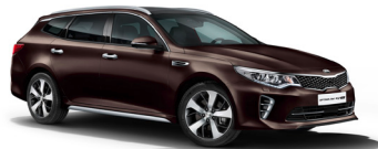
Pluto Brown (G4N) metallic