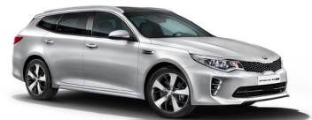
Silky Silver (4SS) metallic