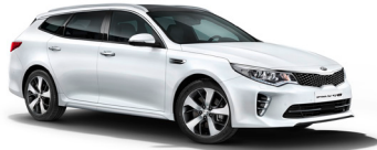
Snow White Pearl (SWP) metallic (pearleffekt)