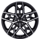
18 " aluminiumfälg (GT Line)