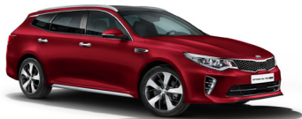
Runway Red (CR5) metallic