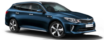
Gravity Blue (B4U) metallic

Kia Motors Sweden AB Kanalvägen 10A 194 61 Upplands Väsby Sverige Tfn: 08 - 400 443 00 www.kia.com