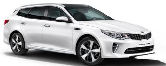
Clear White (UD) solid

*Bilderna nedan visar föregående modell och uppdateras vid senare tillfälle.