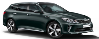
Moss Grey (M5G) metallic