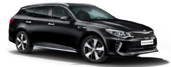
Aurora Black Pearl (ABP) pearleffekt