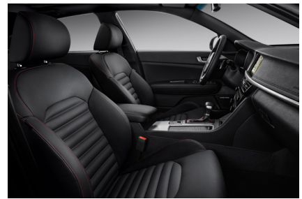
Svart läderklädsel med röda sömmar (GT Line)