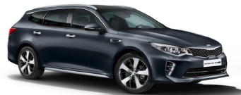
Platinum Graphite (ABT) metallic