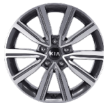
17 " aluminiumfälg (Advance)