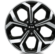
17 " aluminiumfälg (Advance)