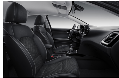
Svart interiör med svart artificiell delläderklädsel. Invändiga detaljer i matt aluminium- och blanksvart finish (Advance Plus)