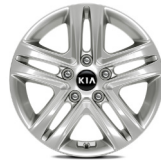
16 " aluminiumfälg (Action)