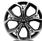
19 " aluminiumfälg (GT Line)