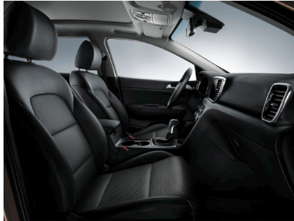
Svart interiör med tygklädsel (Advance)