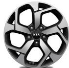
17 " aluminiumfälg (Advance)