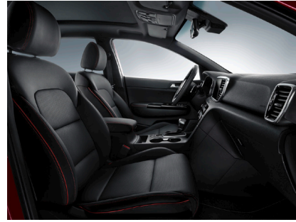
Svart interiör med svart läderklädsel med röda sömmar (GT Line)