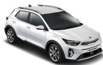
Clear White (UD) solid