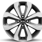
16 " aluminiumfälg