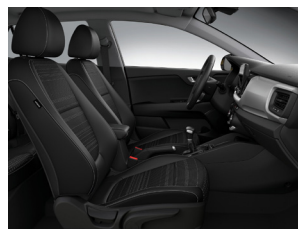
Svart interiör med svart tygklädsel