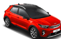
Signal Red / Black (BBE) metallic (pearleffekt)