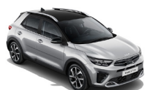
Silky Silver / Black (B4S) metallic