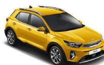
Most Yellow (MYW) metallic (pearleffekt)