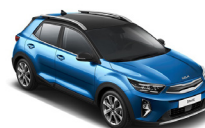
Sporty Blue / Black (BSP) metallic (pearleffekt)