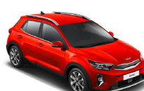
Signal Red (BEG) metallic (pearleffekt)