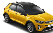
Most Yellow / Black (BMY) metallic (pearleffekt)