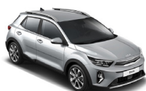
Silky Silver (4SS) metallic