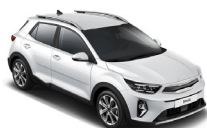
Clear White (UD) solid