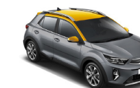
Perennial Gray / Most Yellow (MPR) metallic (pearleffekt)

Kia Sweden AB Kanalvägen 10A 194 61 Upplands Väsby Sverige Tfn: 08 - 400 443 00 www.kia.com