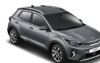
Perennial Gray (PRG) metallic (pearleffekt)