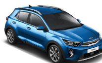
Sporty Blue (SPB) metallic (pearleffekt)