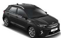
Aurora Black Pearl (ABP) metallic (pearleffekt)