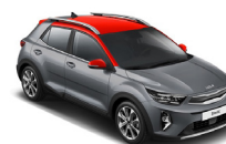
Perennial Gray / Red (RPR) metallic (pearleffekt)