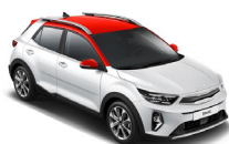
Clear White / Red (RUD)