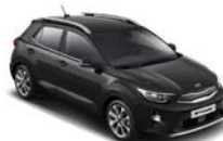
Aurora Black Pearl (ABP) metallic (pearleffekt)