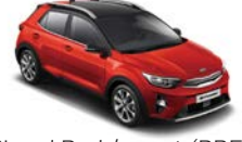
Signal Red / svart (BBE) Flertonsinteriör: grå