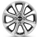
15 " aluminiumfälg (Advance)