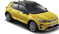
Most Yellow / svart (BMY) Flertonsinteriör: grå

Kia Motors Sweden AB Kanalvägen 10A 194 61 Upplands Väsby Sverige Tfn: 08 - 400 443 00 www.kia.com