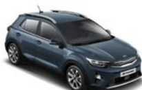
Smoke Blue (EU3) metallic (pearleffekt)