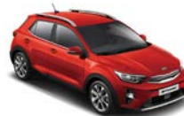
Signal Red (BEG) metallic (pearleffekt)