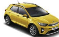
Most Yellow (MYW) metallic (pearleffekt)