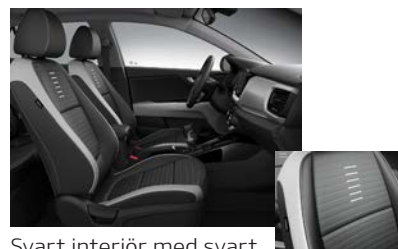
Svart interiör med svart delläderklädsel (konstläder) och flertonsinteriör: svart/grå/grå (Advance Plus)