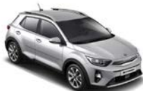
Silky Silver (4SS) metallic