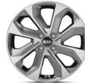
17 " aluminiumfälg (Advance plus)