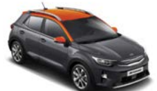
Platinum Graphite / orange (AAX) Flertonsinteriör: grå