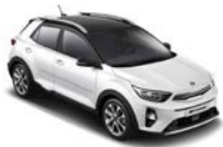
Clear White / svart (BUD) Flertonsinteriör: grå