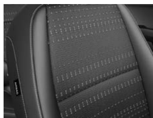
Svart interiör med svart tygklädsel (Advance)