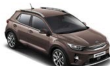
Deep Sienna Brown (SEN) metallic (pearleffekt)