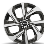
17 " aluminiumfälg (GT Line)