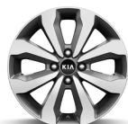
16 " aluminiumfälg (Advance)