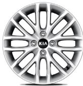
16 " aluminiumfälg (Advance)