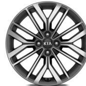
17 " aluminiumfälg (GT Line)