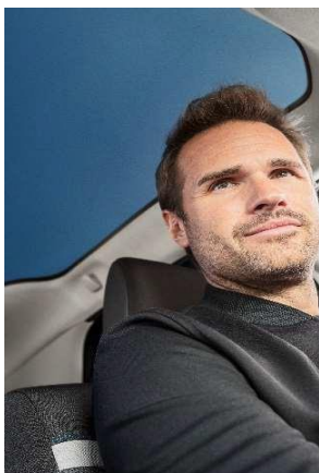
NYCKELFRITT LÅS- & STARTSYSTEM