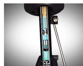
PHC - Progressiv hydraulisk fjädring

Alla våra dieselmotorer kan köras på fossilfritt HVO100