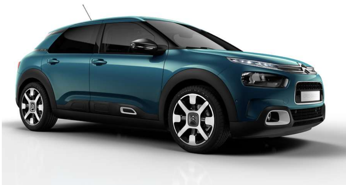
Bilen på bilden är extra utrustad

Se längre ner för C4 Cactus producerade t.o.m. december 2017