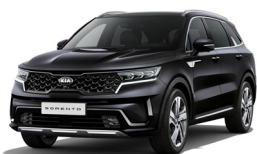
Aurora Black Pearl (ABP) metallic pearleffekt