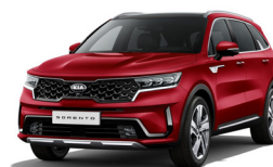
Runway Red (CR5) metallic