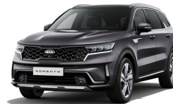
Platinum Graphite (ABT) metallic