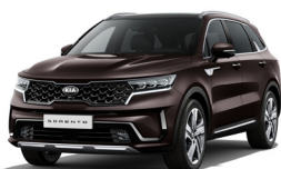
Essence Brown (BE2) metallic