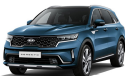
Mineral Blue (M4B) metallic