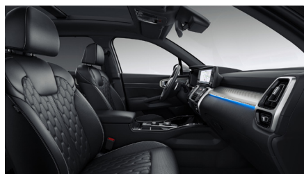
Svart "NAPPA" läderklädsel (Advance Plus)