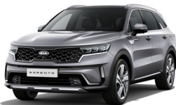
Steel Grey (KLG) metallic