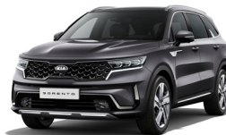
Platinum Graphite (ABT) metallic