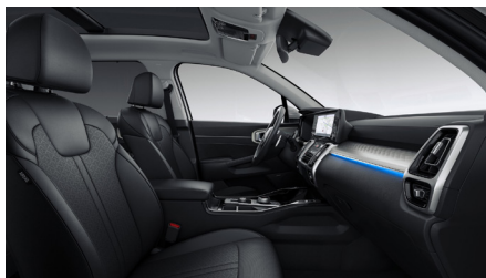
Svart läderklädsel (Advance)