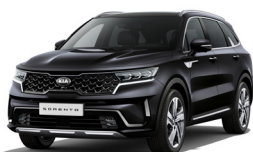
Aurora Black Pearl (ABP) metallic pearleffekt