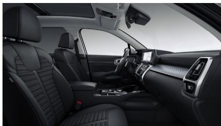
Mörk Tygklädsel (Action)