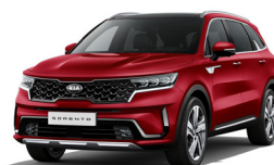
Runway Red (CR5) metallic

Kia Motors Sweden AB Kanalvägen 10A 194 61 Upplands Väsby Sverige Tfn: 08 - 400 443 00 www.kia.com