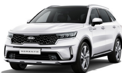
Snow White Pearl (SWP) metallic pearleffekt