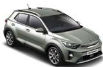
Urban Green (URG) metallic (pearleffekt)