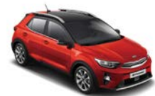
Signal Red / svart (BBE) * Flertonsinteriör: grå