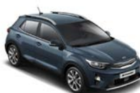
Smoke Blue (EU3) * metallic (pearleffekt)