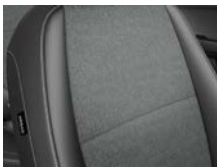
Svart interiör med svart tygklädsel (Action)