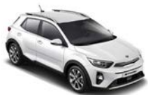
Clear White (UD) solid