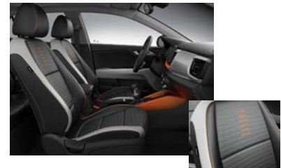
Svart interiör med svart delläderklädsel och flertonsinteriör: svart/grå/orange (Advance Plus)