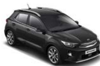
Aurora Black Pearl (ABP) metallic (pearleffekt)