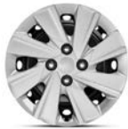
15 "plåtfälg med hjulsida (Action)