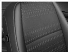
Svart interiör med svart tygklädsel (Advance)