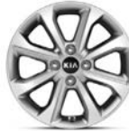
15 " aluminiumfälg (Advance)