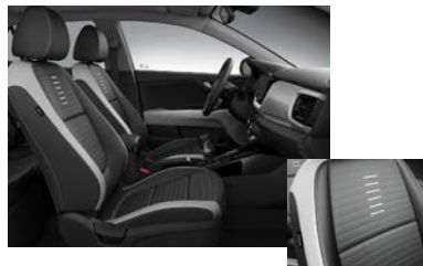
Svart interiör med svart delläderklädsel och flertonsinteriör: svart/grå/grå (Advance Plus)