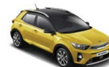
Most Yellow / svart (BMY) * Flertonsinteriör: grå

Kia Motors Sweden AB Kanalvägen 10A 194 61 Upplands Väsby Sverige Tfn: 08 - 400 443 00 www.kia.com