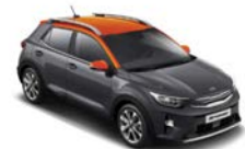
Platinum Graphite / orange (AAX) Flertonsinteriör: orange