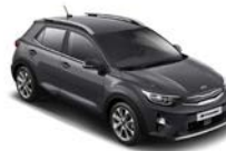
Platinum Graphite (ABT) metallic (pearleffekt)