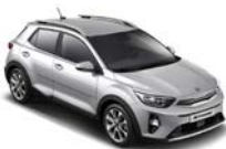
Silky Silver (4SS) metallic