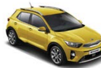
Most Yellow (MYW) * metallic (pearleffekt)