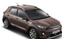
Deep Sienna Brown (SEN) * metallic (pearleffekt)