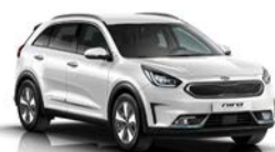
Snow White Pearl (SWP) metallic (pearleffekt)