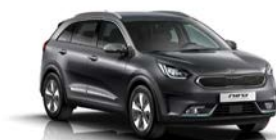
Platinum Graphite (ABT) metallic