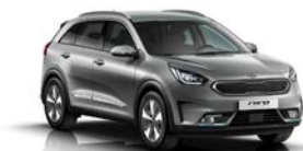
Metal Stream (MST) metallic