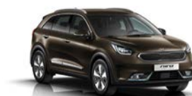
Rich Espresso (DN9) metallic

Kia Motors Sweden AB Kanalvägen 10A 194 61 Upplands Väsby Sverige Tfn: 08 - 400 443 00 www.kia.com