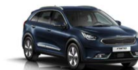
Gravity Blue (B4U) metallic