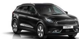
Aurora Black Pearl (ABP) metallic (pearleffekt)