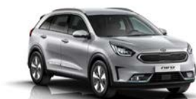
Silky Silver (4SS) metallic