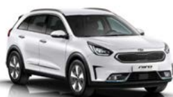
Clear White (UD) solid