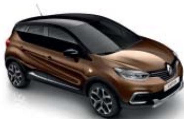
Brun "Cappuccino" (ML) Tak i svart "Étoilé" (ML)