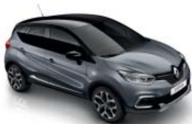
Grå "Cassiopee" (ML) Tak i svart "Étoilé" (ML)