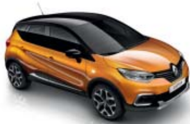
Orange "Atacama" (ML) Tak i svart "Étoilé" (ML)