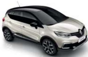
Vit "Ivoire" (SL) Tak i svart "Étoilé" (ML)