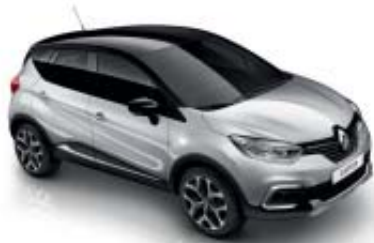
Grå "Platine" (ML) Tak i svart "Étoilé" (ML)