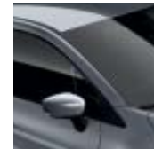
Tak i grått "Cassiopee" (ML)