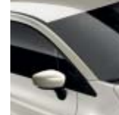
Tak i vitt "Ivoire" (SL)