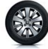
16" aluminiumfälg "Adventure"