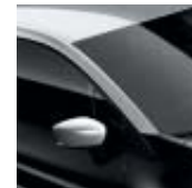
Tak i grått "Platine" (ML)