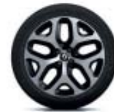
17" aluminiumfälgar "Emotion"