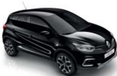
Svart "Étoilé" (ML) Tak i svart "Étoilé" (ML)