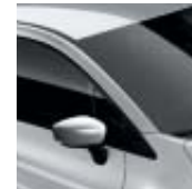
Tak i grått "Platine" (ML)