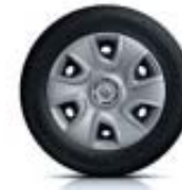
Hjul kapsel 16" Extreme