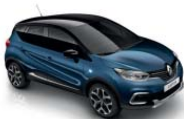
Blå "Marine Fumé" (SL) Tak i svart "Étoilé" (ML)