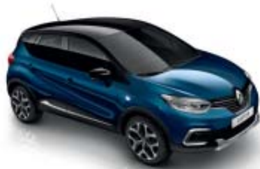
Blå "Océan" (ML) Tak i svart "Étoilé" (ML)