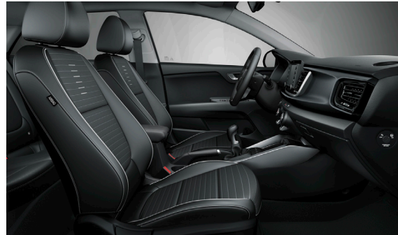
Svart interiör med svart delläder och grå kontrast-sömmar (konstläder). Instrumentpanel: detaljer i kolfiberfinish (GT Line)