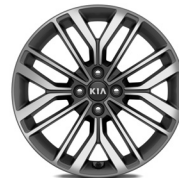
17 " aluminiumfälg (GT Line)