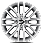
16 " aluminiumfälg (Advance)